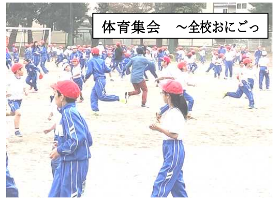
体育集会 ~全校おにごっ